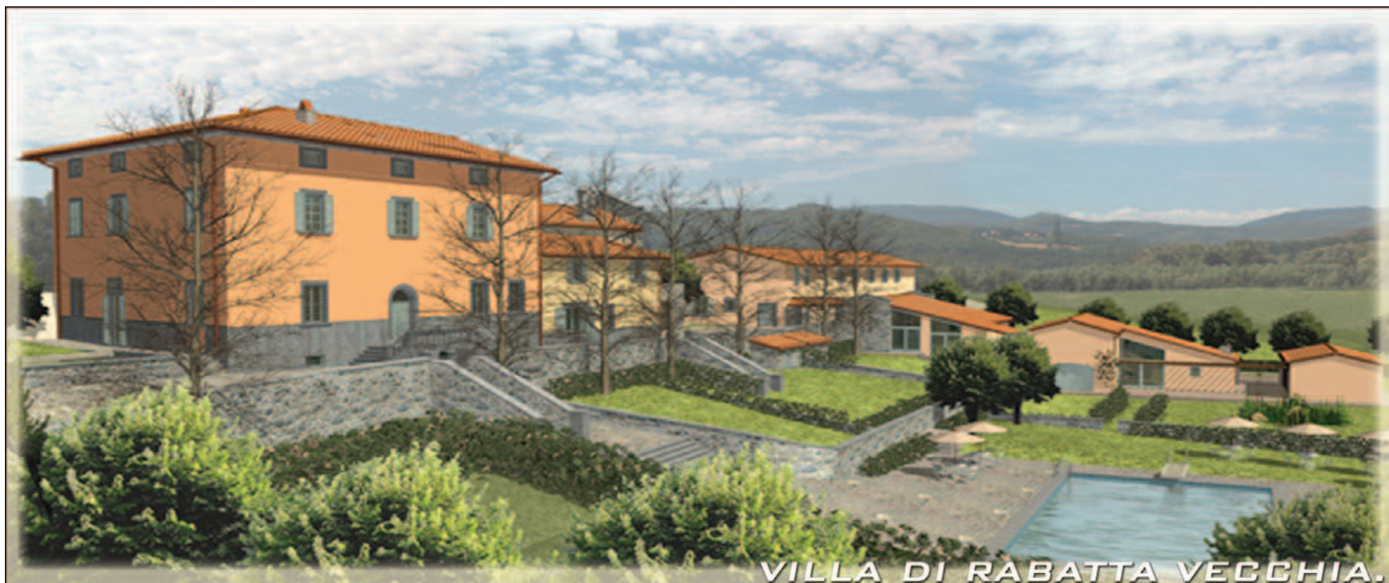
VILLA DI RABATTA VECCHIA.