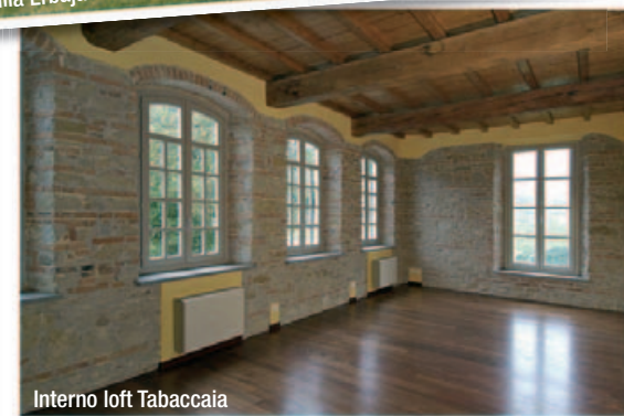
Interno loft Tabaccaia